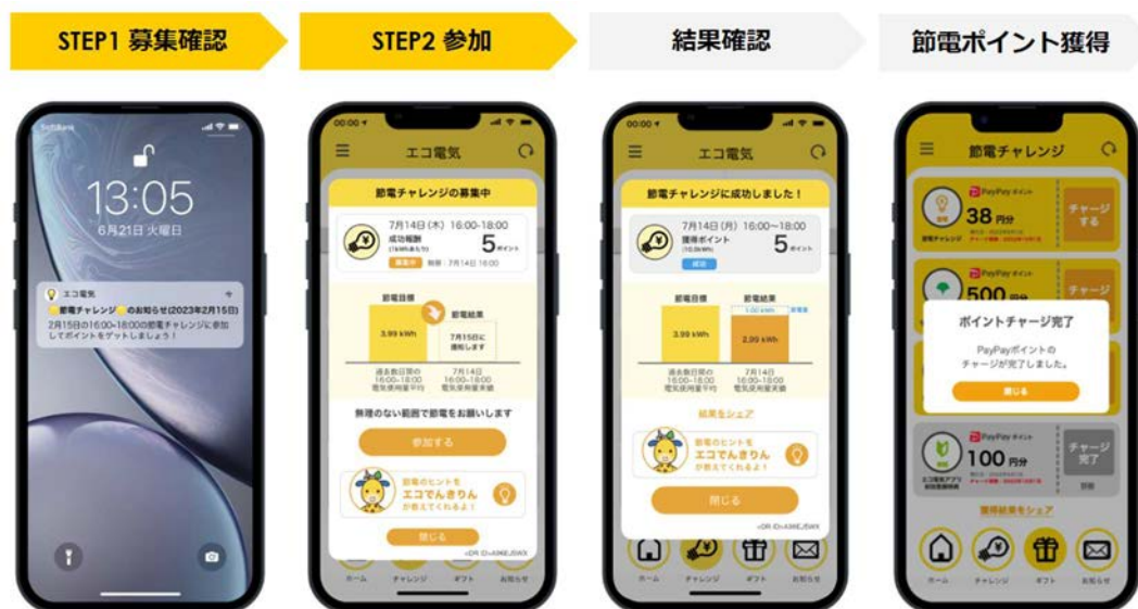
「エコ電気アプリ」の節電チャレンジの操作イメージ

※1 詳細は、東京都が推進する「家庭の節電マネジメント（デマンドレスポンス）事業」に関するウェブサイト（ https://www.tokyo-co2down.jp/subsidy/demand_response ）をご参照ください。