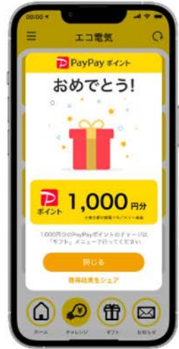
ポイント付与イメージ