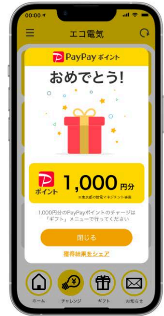
ポイント付与イメージ