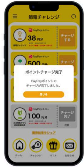
「エコ電気アプリ」の操作イメージ